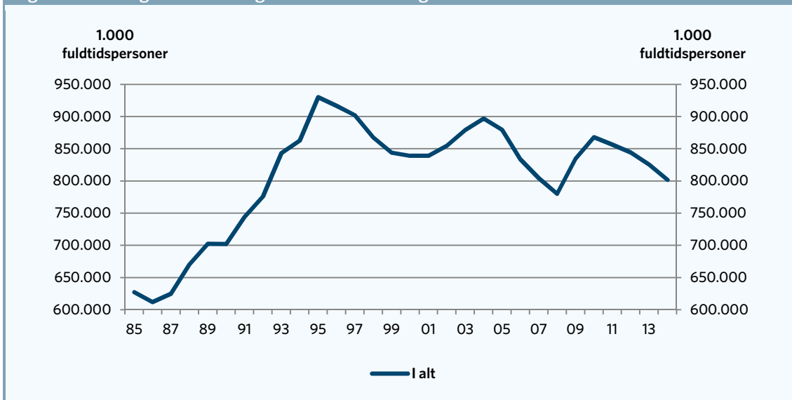
Figur 1. Udviklingen i 16-64-årige overførselsmodtagere

Ser man på de 16-64-årige gennem hele perioden, er antallet af overførselsmodtagere mellem 16 og 64 år faldet fra ca. 930.000 fuldtidspersoner i 1995 til ca. 800.000 i 2014 – et fald på ca. 130.000 fuldtidspersoner. I pct. af befolkningen mellem 16 og 64 år er gruppen af overførselsmodtagere faldet fra 26,8 pct. til knap 22,5 pct.